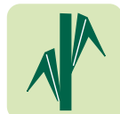
Port de feuilles semi-retombant