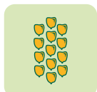
Nbre de grains/rang 26-30