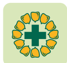
Nbre de rangs 16