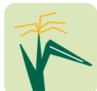
Moy. hauteur plante +10 cm / TC1 177