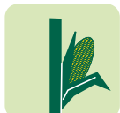
Moy. hauteur épi = TC1 177